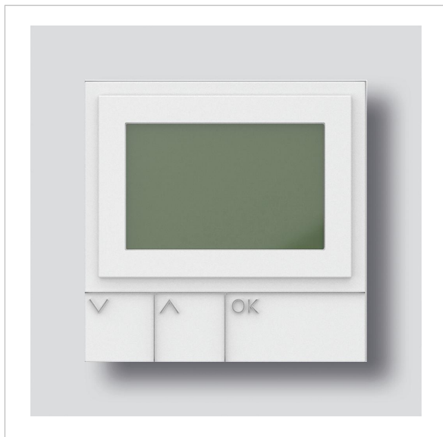
Display-Ruf-Modul DRM 612-02 W