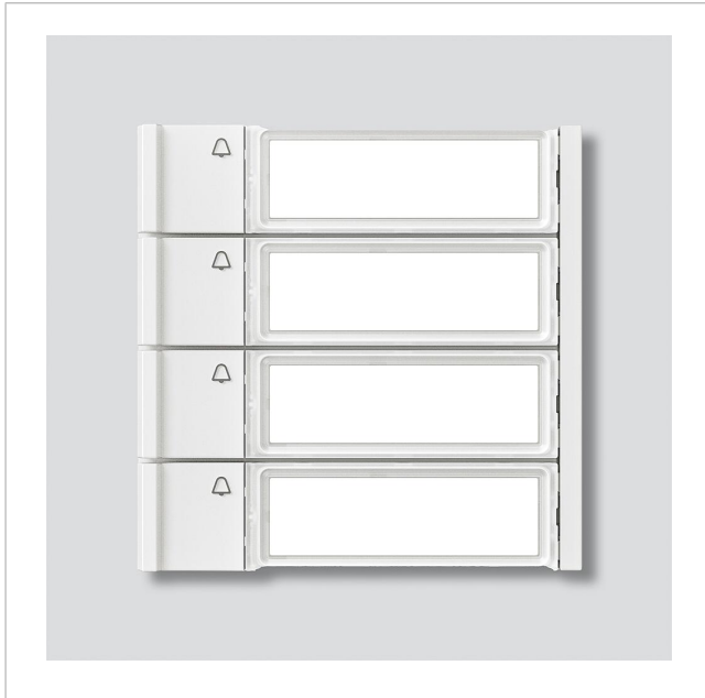
Ruftasten für Siedle Vario TM 700-4-0 W 210011974-00